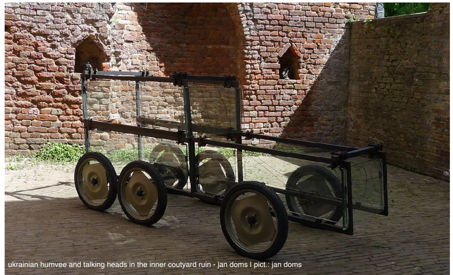
ukrainian humvee and talking heads in the inner courtyard ruin - jan doms | pict.: jan doms

Adres - Ingang | address - entrance: Korte Welleweg 1, 3218 AZ Heenvliet (NL)